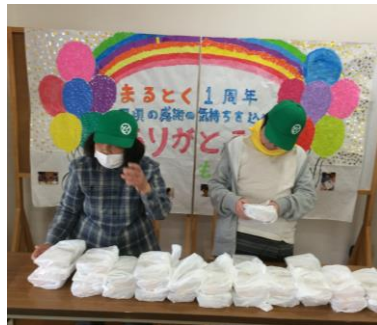
『紅白まんじゅう配布』