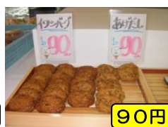
玉子・牛コロッケ