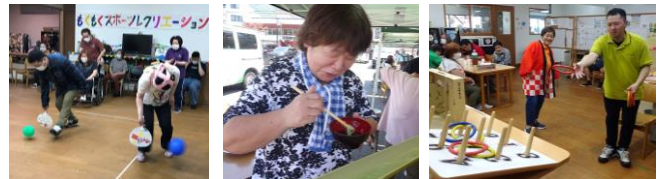
【スポーツレク】 【そうめん流し】 【夏祭り】

昨年は新型コロナウイルスの感染拡大防止のため外出行事は行わず、手洗いや消毒、マスクなど感染予防をしっかり行いながら、もくもくの中で出来る行事として、スポーツレクリエーションや昼食会、そうめん流し、夏祭りなどを行いみんなで楽しみました。